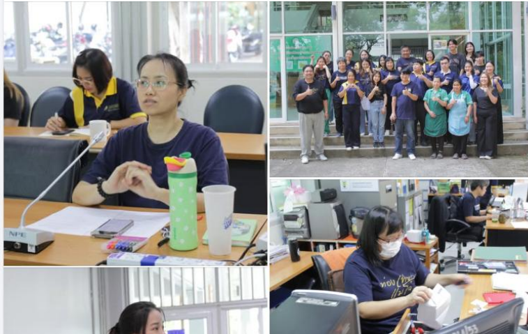
ประชาสัมพันธ์กิจกรรม 5 ส. คณะพัฒนาการท่องเที่ยว

#MJU #TDS #TDSMJU #TD #TourismDevelopment #มหาวิทยาลัยแม่โจ้ #คณะพัฒนาการท่องเที่ยว #ท่องเที่ยวแม่โจ้ #TDSGREENOFFICE