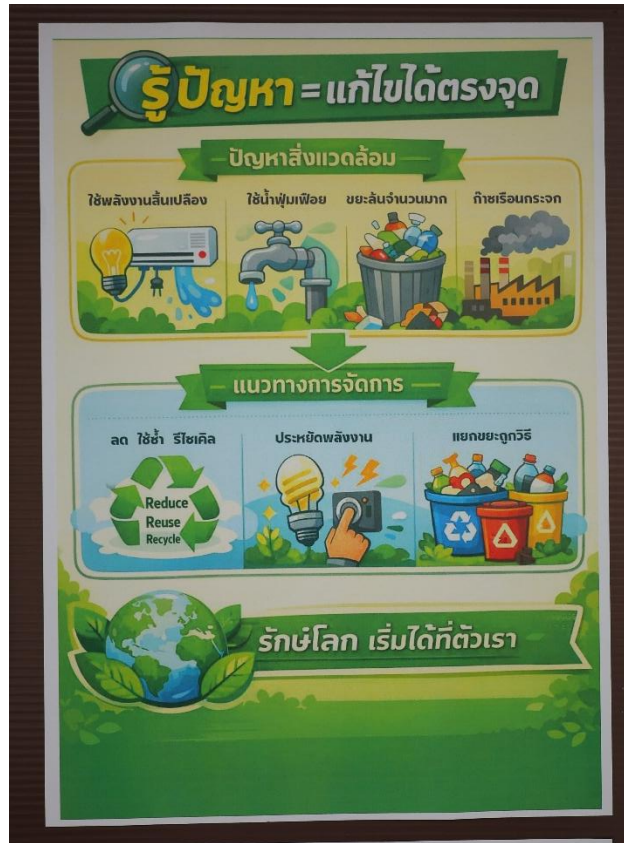
บอร์ดประชาสัมพันธ์