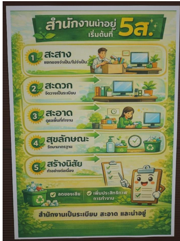
บอร์ดประชาสัมพันธ์