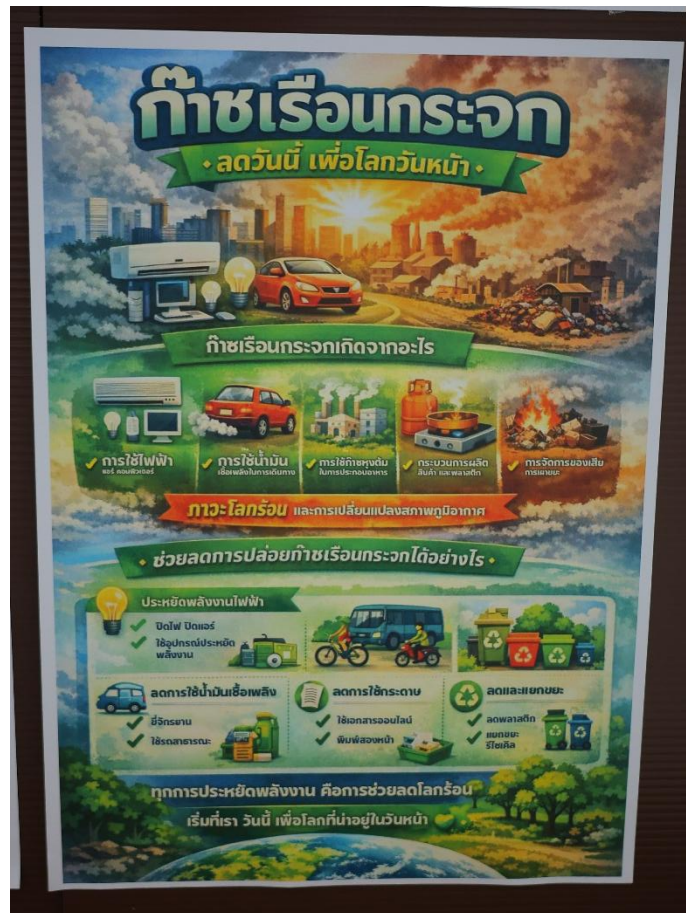
บอร์ดประชาสัมพันธ์

คณะกรรมการหมวดที่ 2 ได้จัดทำใบความรู้ และประชาสัมพันธ์ ผ่านช่องทาง บอร์ดประชาสัมพันธ์ และกลุ่ม LINE สำนักงานสีเขียวคณะกรรมการท่องเที่ยว เพื่อให้ความรู้ในการช่วยในการลดการปล่อยก๊าซเรือนกระจก