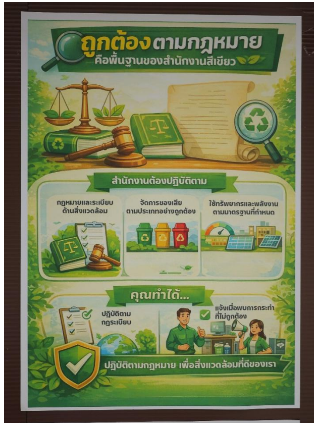
บอร์ดประชาสัมพันธ์