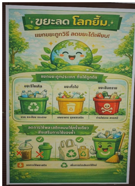
บอร์ดประชาสัมพันธ์